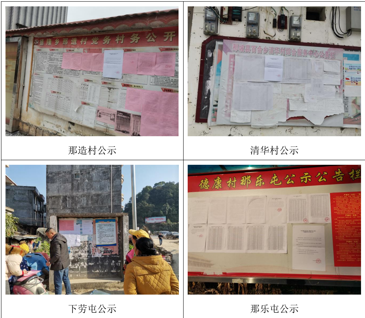
图 4 本项目环境影响报告书征求意见稿公示现场张贴情况照片