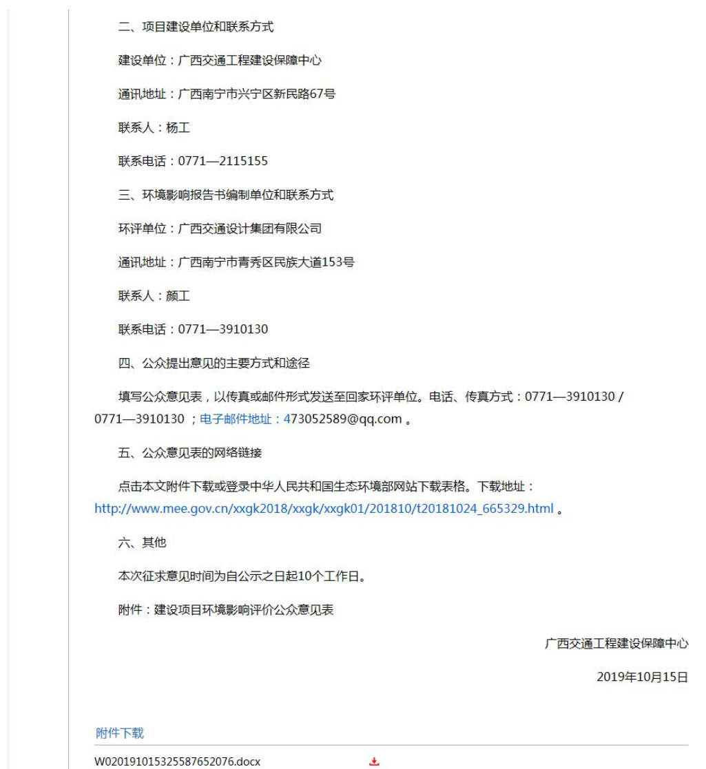
图 1 本项目首次环境影响评价信息网上公开截图